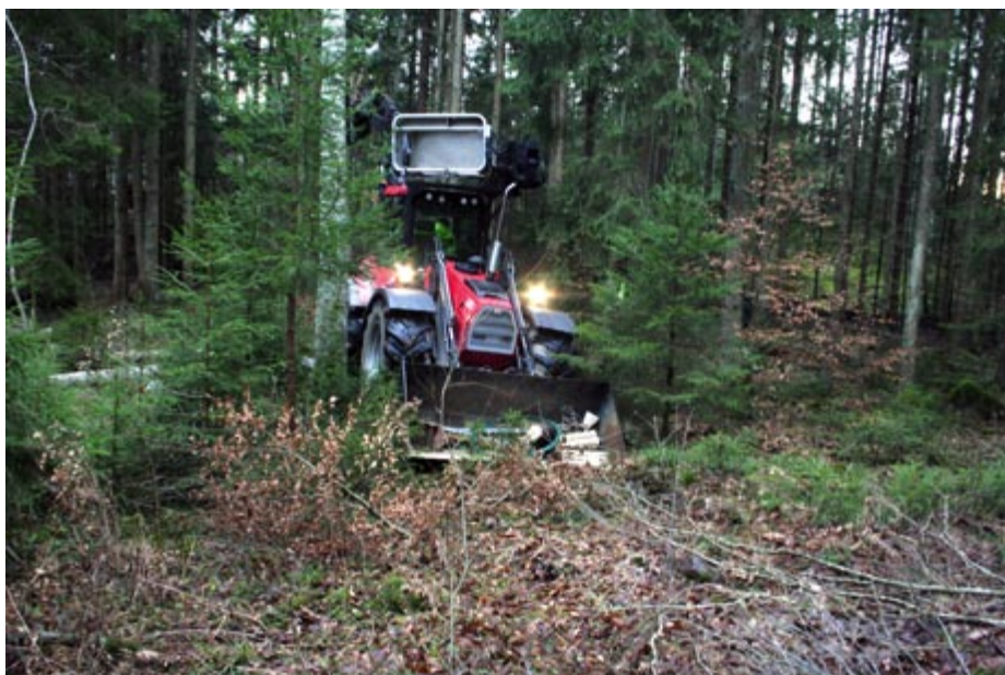
SVÅR TERRÄNG. Olofström handhar 200 mil elnät. Mycket av det i svår terräng. Tidigare har nätet varit känsligt för avbrott men det har förbättrats sedan Gudrun. Totalt har 150 miljoner satsats och det försätter även i år.

I början av veckan fick Kraftbolaget sig en känga för att ha den dyraste elen i länet. I samma veva har kraftbolagets styrelse beslutat att höja taxan inför